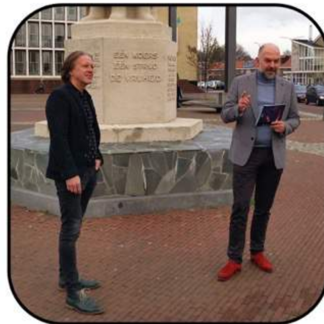
Overhandiging 1e Exemplaar Beelden van Velsen