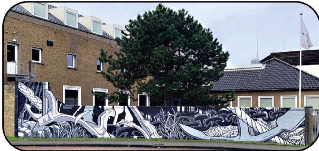
Wageningen Marine Research