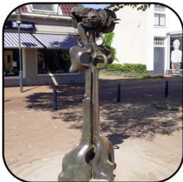
Victor de Beijer