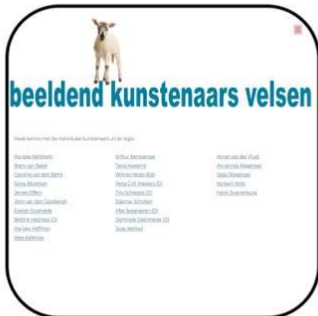
Netwerk Velsers Kunstenaars