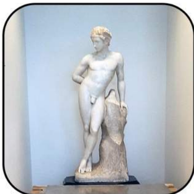
Nieuwe Opstelling Hermes-beeld