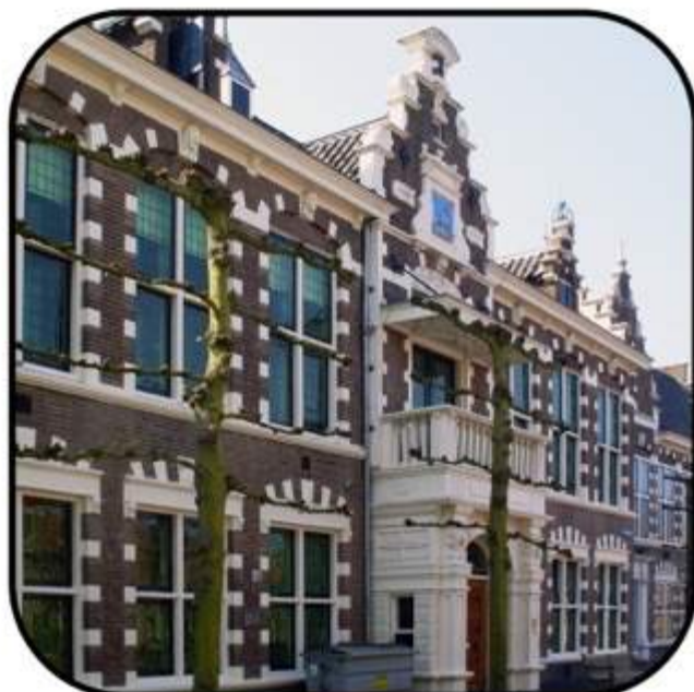
Voormalige Opslag Binnencollectie