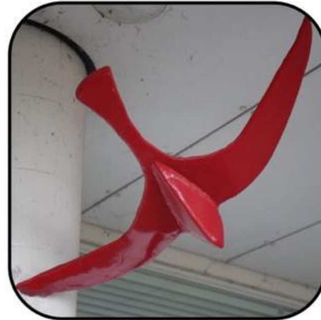
Te Herstellen Objecten