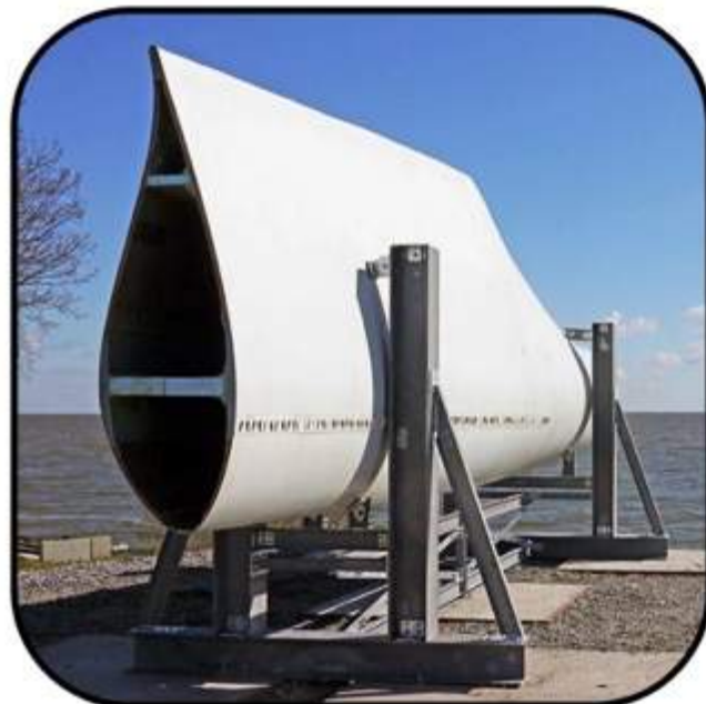
Het Waait voor Ons: huidige situatie