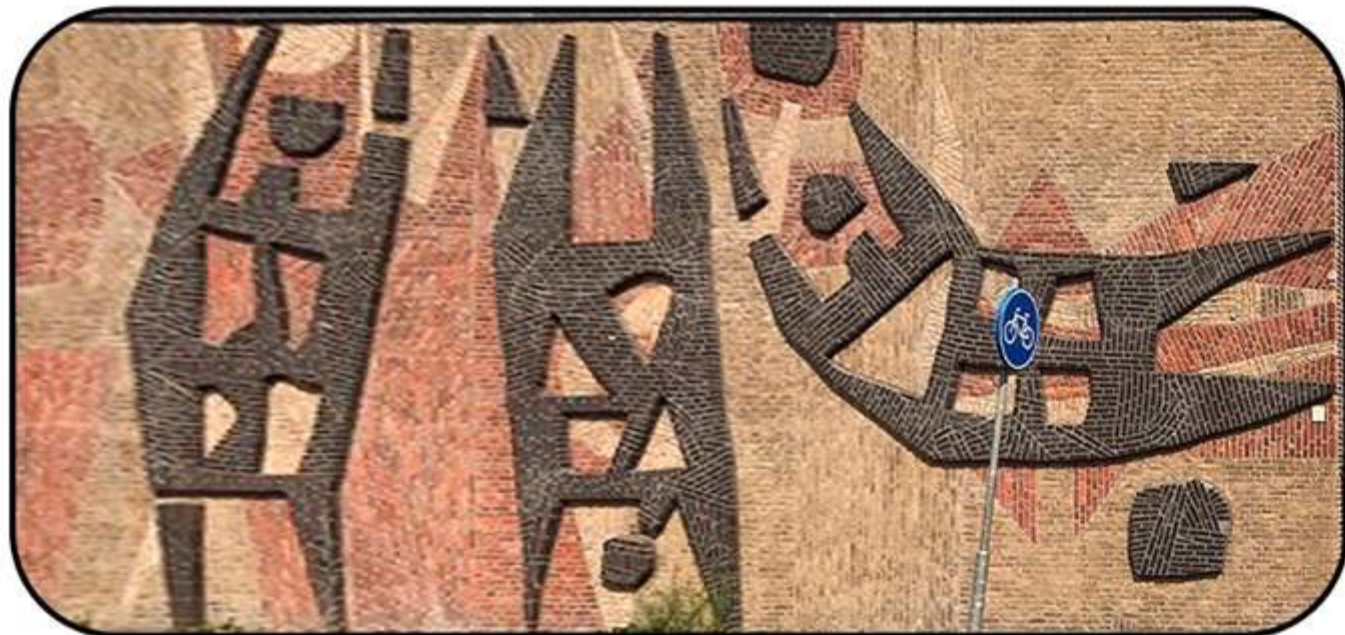
Bouke Ylstra [gymzaal IJmuiden]