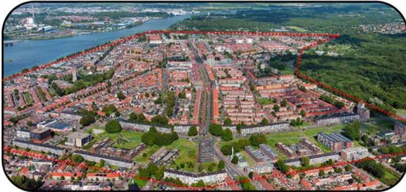
Pont tot Park