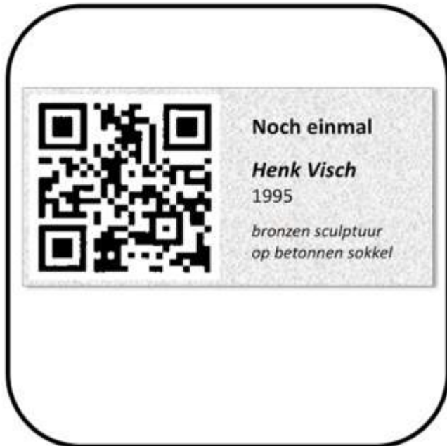
Informatiebordjes met QR-code