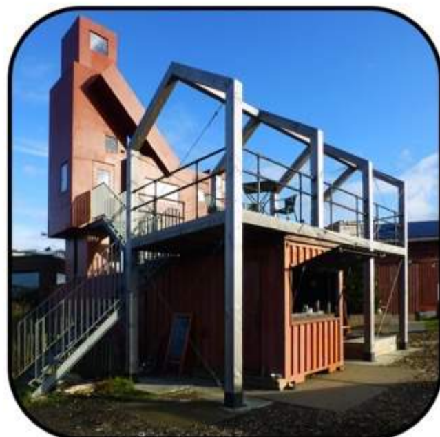
Atelier van Lieshout