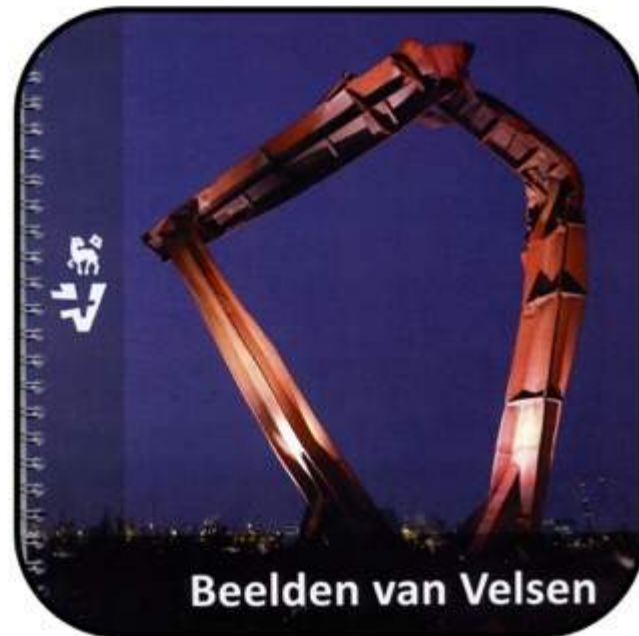
3 e editie Beelden van Velsen