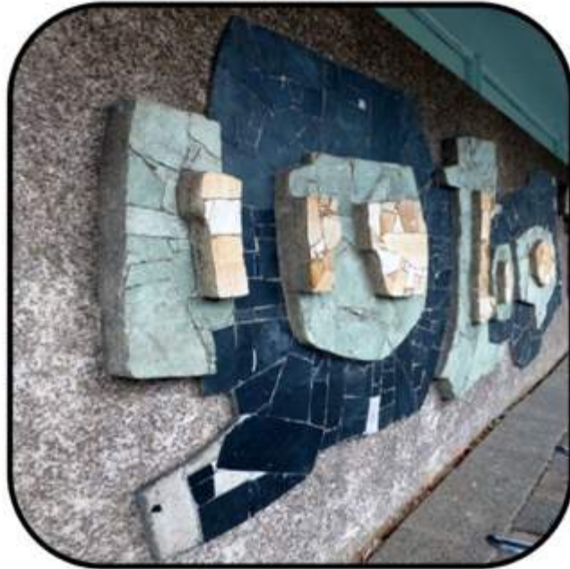
Verdwenen / Bedreigde Reliëfs