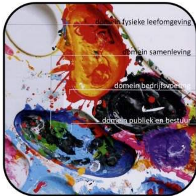
Samenwerking tussen domeinen