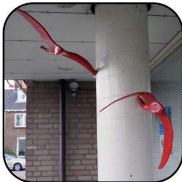
De Graaf & Havas