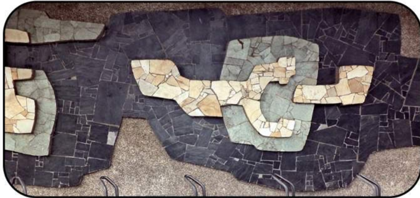
René Karrèr [Dekamarkt Santpoort-Zuid]